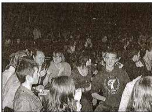
Le public de 17 à 77 ans n'a pas boudé son plaisir avec le déjanté quatuor.

Un quatuor créé il y a déjà 17 ans par de jeunes Rennais et qui depuis cette époque fait le bon-